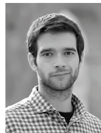
Par Guillaume Dumas, Maître de conférences en sciences de gestion, université Toulouse 3 Paul Sabatier