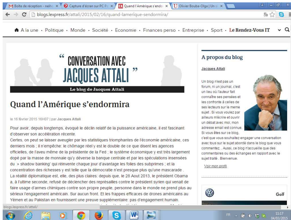
Figure 5 : Capture d'écran du blog de Jacques Attali

Le blog de Jacques Attali a un PageRank élevé, égal à 5. Il s'intitule « Conversation avec Jacques Attali ». Il est hébergé par le site de L'Express . Par ce titre mais aussi par son attitude sur la photo qu'il a choisie pour illustrer sa présentation, Jacques Attali affiche sa volonté de créer une sorte d'intimité avec le lecteur. La présentation écrite du blog, sur la gauche, le confirme. Il y est par exemple écrit : « Un blog (...) c'est un lieu où l'auteur fait connaître ses pensées et les confronte à celles de ses lecteurs sur le même sujet ». L'idée de débat d'égal à égal entre le blogueur et son lecteur semble évoquée. Néanmoins, dans la phrase suivante, Jacques Attali nuance son propos et se positionne en unique meneur du débat sur son blog. Il écrit : « Si vous êtes sur ce blog, c'est que vous souhaitez engager une conversation avec tous sur le sujet abordé dans le blog que vous commentez. Aussi, ce blog n'accueille que des commentaires ou des