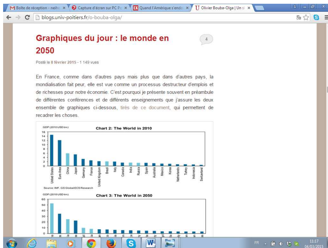
Figure 6 : Capture d'écran du blog d'Olivier Bouba Olga.

..... En définitive, à travers ce chapitre, nous avons tout d'abord démontré qu'il serait erroné de penser que le développement des blogs, en abaissant les coûts économiques de production et de publication d'un discours politique, aurait entraîné une baisse concomitante des ressources socioculturelles nécessaires à la prise de parole politique. Néanmoins, il a aussi été démontré que la forte proportion d'individus impliqués (de quelque manière que ce soit) en politique (61.4%), et plus encore de professionnels de la politique (50.4%) parmi les membres du « Panel Blogs Politiques » ne devait pas faire oublier la diversité des blogueurs politiques, tant en matière de position sociale que de détention de ressources médiatiques. Une des distinctions les plus importantes oppose en effet les blogueurs professionnels de la politique aux « simples » amateurs. Outre la spécificité du blogage politique, la faiblesse des ressources capitalisables internes à la