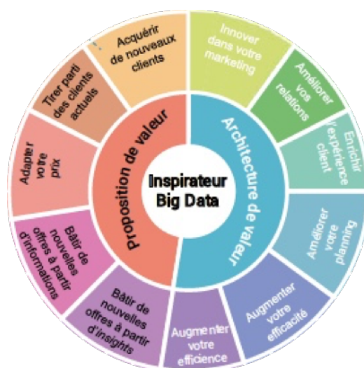
Figure 3 : Les directions de la roue de l'innovation stratégique par les big data (Auteurs, 2018).

Nous présentons en détail chaque direction d'innovation dans les deux sections suivantes, avec pour chacune, les études de cas utilisés pour la caractériser et un exemple synthétisé d'une étude de cas caractéristique.