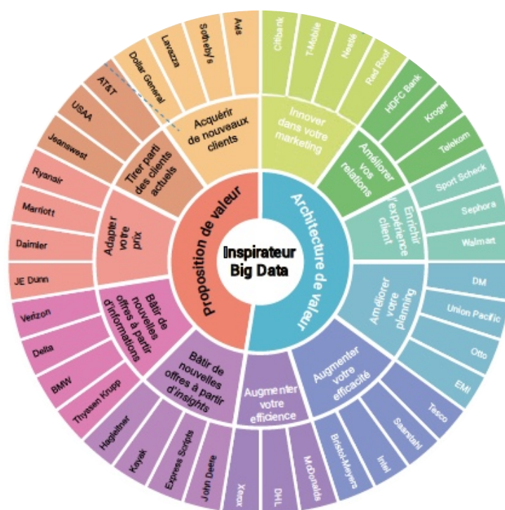
Figure 4 : La roue de l'innovation stratégique via les big data (Auteurs, 2018)

Nous résumons les directions et études de cas traitées dans la roue de l'innovation du big data comme suit.