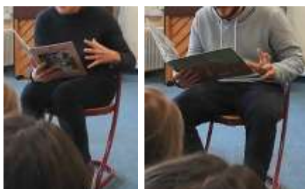
Figure 3 : Gestes égocentrés

Dans les illustrations suivantes (Fig.3), les gestes de la main gauche sont égocentrés, c'est-à-dire qu'ils ne sont pas pensés (et donc produits) pour les interlocuteurs : ils sont peu visibles, cachés par l'album pour la plupart des camarades. Et pourtant, ces gestes iconiques co-verbaux (McNeill, 1992) sont réalisés spontanément en concomitance avec le terme clé de l'énoncé.