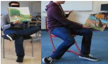
Figure 1 : Corps-pupitres

L'analyse a fait ressortir, dans la majeure partie des cas, une non prise en compte de la dimension corporelle dans la préparation de la lecture. Nos notes de terrain soulignent en effet que, spontanément, très peu de stagiaires cherchaient à adapter le corps à leur lecture pour lui donner vie. Il leur semblait en revanche assez évident que leurs voix soient modifiées pour faire entendre le loup, la grand-mère, le petit ours, etc. Il est alors peu surprenant que, dans les captures d'écran issues des vidéos, les corps des stagiaires soient, pour l'essentiel, réduits à un corps-pupitre appréciable pour montrer ou lire l'album (Fig.1).