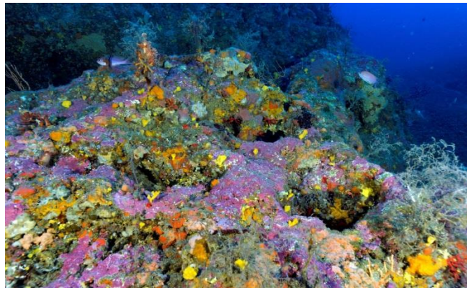
Figure 2 (à gauche) : Tombant de coralligène à Villefranche-sur-mer