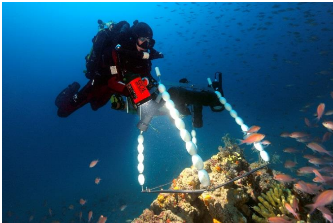
Figure 5 : Plongeur en recycleur (circuit fermé) réalisant des quadrats photographiques sur un récif coralligène selon la méthode de Deter et al. (2012b).