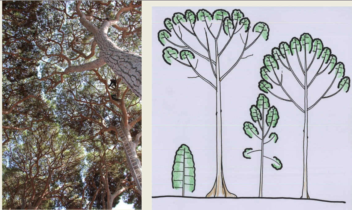
Figure 2. A : Timidité entre couronnes et intra couronnes chez le pin pignon ( Villa Thuret). B : Mise en place de l'architecture adulte avec individualisation des cimettes chez Dryobalanops aromaticum (d'après Hallé & Ng, 1981).

s'isoler. Ce comportement peut s'observer entre couronnes d'individus différents mais aussi à l'intérieur d'une même couronne individualisant des sous-ensembles de la couronne parfois appelés des cimettes (Figure 2A). Cette timidité intra-couronne a été illustrée par F. Hallé et F. Ng sur les arbres de la famille des Dipterocarpaceés (1981) en utilisant la notion de réitération pour préciser la mise en place de ce phénomène (Figure 2B). Cette notion, classique en architecture végétale, correspond au développement d'individus nouveaux au sein de la couronne d'un arbre existant.