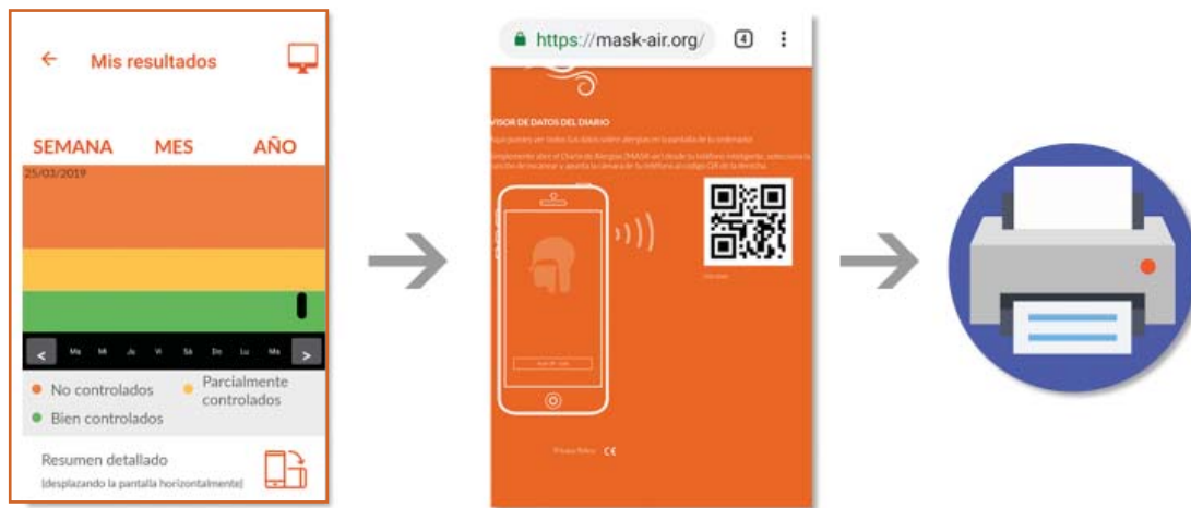
Figura 3. Demostración de cómo transferir datos de síntomas y medicación que el paciente marcó diariamente en su celular, a la computadora de su médico al momento de la consulta: usando el código QR de la app (referencia 10):