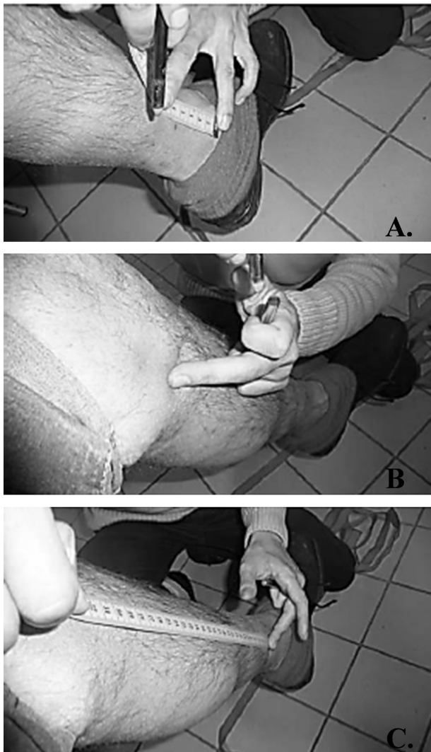
Figure 3. Préparation du patient. Repérage de la hauteur d'appui de la sangle, 5 cm au-dessus de la malléole médiale (A) ; repérage de l'interligne articulaire du genou (B) ; mesure de la distance entre les deux traits correspondant au bras de levier (C).