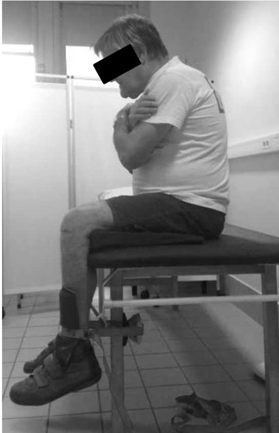
Figure 1. Vue d'ensemble du dispositif et d'un patient réalisant une contraction maximale volontaire du quadriceps.

permettant le réglage de la hauteur de la sangle. Le dynamomètre est ensuite interposé entre la sangle et le tibia du patient. Une pièce de mousse est intercalée entre le capteur et le tibia et une autre pièce de mousse est intercalée entre la sangle et le dynamomètre. Dans ce cas, l'opérateur stabilisera le dispositif en veillant à ne pas appliquer de force supplémentaire (Fig. 2A). Une alternative est de fixer le dynamomètre à l'arrière (dans le cas d'un dynamomètre fonctionnant en compression comme le MicroFet2™) ou à l'avant (dans le cas d'un dynamomètre fonctionnant en traction) du pied de la table d'examen/bureau. L'embout du capteur utilisé est celui qui s'adapte le mieux au pied de la table ou bureau. Dans le cas du MicroFet2™, la sangle réglable prend appui sur la face postérieure du capteur et contourne la face antérieure de la jambe du patient (Fig. 2B).