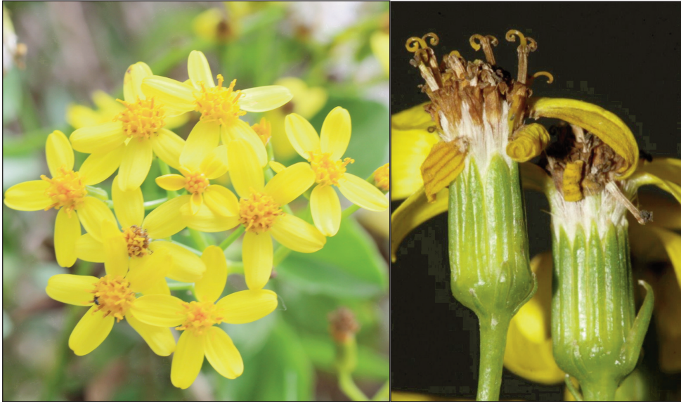
Fig. 2. Capitules de Senecio angulatus (Annaba-Algérie).

Sur le plan économique notamment celui pastoral, cette plante ne présente pas de valeur nutritive ou fourragère pouvant lui attribuer un intérêt agro-pastoral. En effet, les espèces de Senecio sont en général connues pour être toxiques pour le bétail (Burrows & Tyrl 2001; Riet-Correa & al. 2017). Néanmoins, l'étude d'Andreani (2014) montre que cette plante est riche en huiles essentielles et possédant des propriétés antioxydantes ce qui indique un éventuel intérêt économique et médicinal.