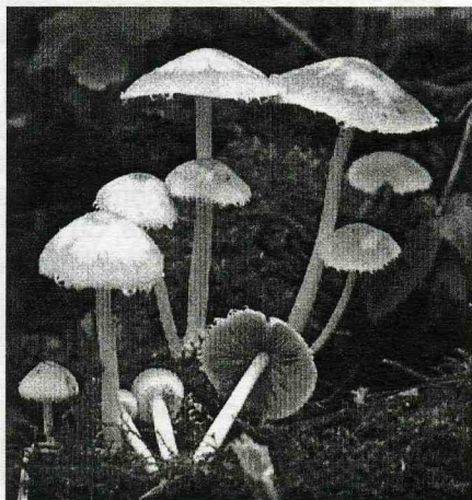
Agaricus violaceo-lamellatus DC (= Psathyrella candolleana (Fr.: Fr.) Quélet)

En effet, est-ce par coïncidence, Candolle arrête la mycologie juste avant la grande révolution mycologique. En 1821, un jeune botaniste suédois de 24 ans, Elias Magnus Fries, publie un ouvrage extraordinaire qui produira une véritable révolution en mycologie : le Systema Mycologicum , une classification complète et « naturelle » des champignons, fondée sur de nouveaux caractères (dont l'insertion des lames sur le pied), et reprenant à son tour, mais avec une intuition géniale, tous les travaux de ses prédécesseurs pour les unifier et en présenter une remarquable synthèse. Fries choisit ainsi, parmi les nombreux noms attribués à diverses espèces, un nom « sanctionné 36 » qui sera défi-