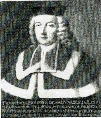
François BOISSIER DE SAUVAGES (Alès, 1706 – id., 1767).

La diversité du vivant n'a jamais ménagé la fierté des naturalistes, mais les meilleurs s'en accommodent plus volontiers que Sauvages, qui pestait contre ce foisonnement insolent. La courte partie mycologique de son œuvre s'en ressent : seuls 39 champignons sont cités, avec des noms déjà