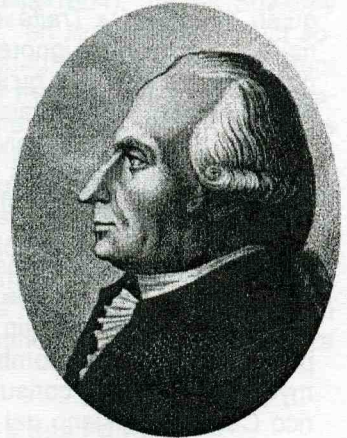
Antoine GOÜAN (Montpellier, 1733 – id., 1821)