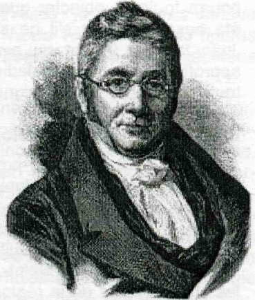
Augustin-Pyramus de CANDOLLE (Genève, 1778 – id., 1841)

Dans ses « Mémoires et Souvenirs », Candolle affirme : « Cette partie de la Flore fut la plus soignée et celle qui eut le plus de succès auprès des vrais connaisseurs » 30 . En effet la troisième édition de la « Flore Française » s'impose comme la référence la plus incontournable en France, y compris sur la partie mycologique : elle le doit à l'influence considérable de Lamarck, qui signe en premier auteur ce travail presque entièrement refondu par Candolle, mais aussi parce que cet