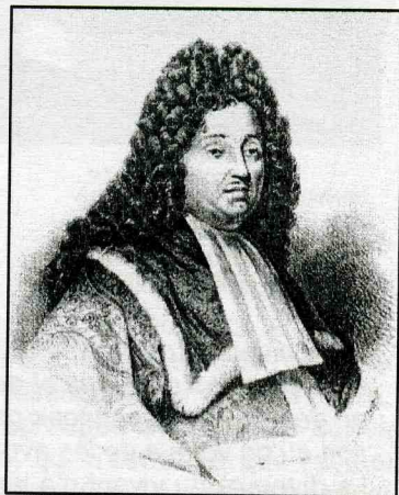
Pierre MAGNOL (Montpellier, 1638- id., 1715)

Ses quatre ouvrages, consacrés à la flore méditerranéenne, sont loin de constituer un catalogue significatif, mais on trouve dans Botanicon Montspelienese , publié en 1676, une première liste de 20 espèces de champignons, cités alphabétiquement dans le genre Fungus , avec les noms patois (mourille, boulet, pivoulade, coucoumele, mascarille, gérille, jaune d'iou) et de courtes descriptions mettant surtout l'accent sur la couleur, l'habitat (forêt, prairies, arbres) et la croissance isolée ou en touffes, ainsi que sur l'inquiétante variabilité de toutes ces espèces. Magnol cite les quelques auteurs l'ayant précédé : Jean Bauhin, Clusius et Lobelius, mais surtout les romains Pline l'Ancien et Horace, dont il discute quelques sentences imprudentes ; ainsi : « Pratentibus optima fungis natura » (une légende qui perdure encore sous la forme moderne : « pas de champignons toxiques dans les prés ! ») mais cet aphorisme était déjà contredit par les propres observations de Magnol.