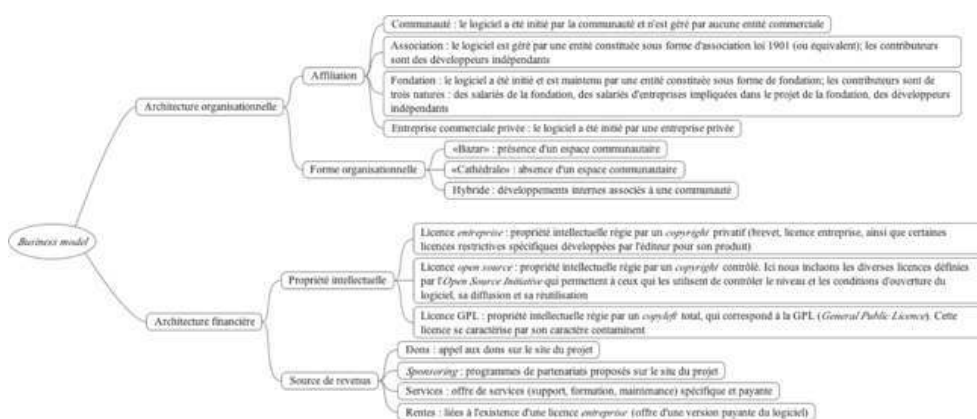
Figure 2. Les variables du modèle