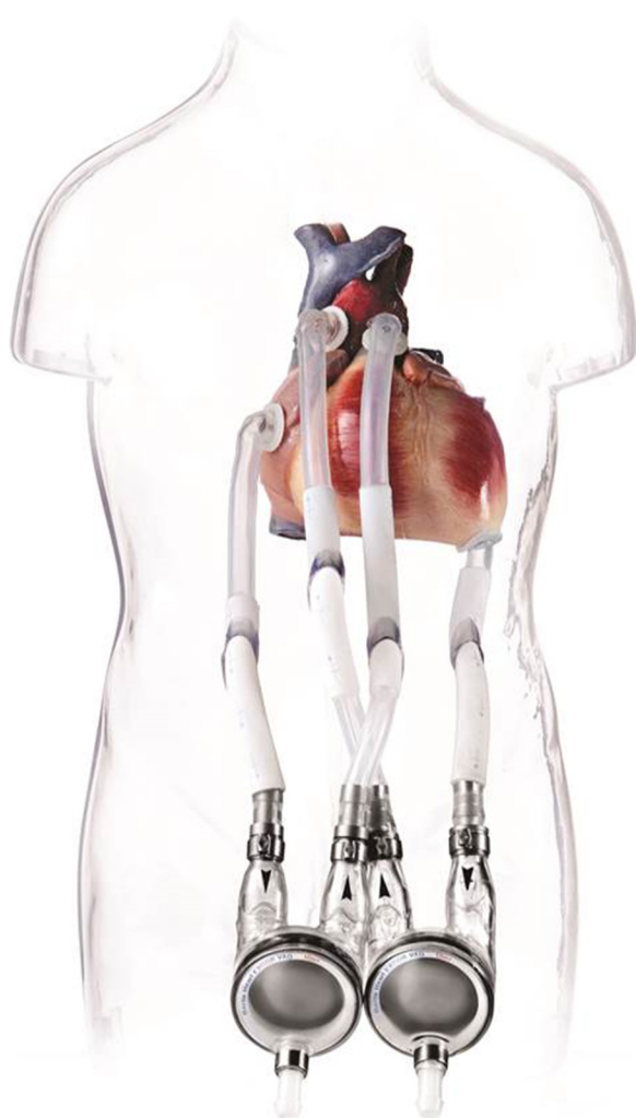
FIGURE 3 Configuration des ventricules artificiels gauche et droit Berlin Heart Excor